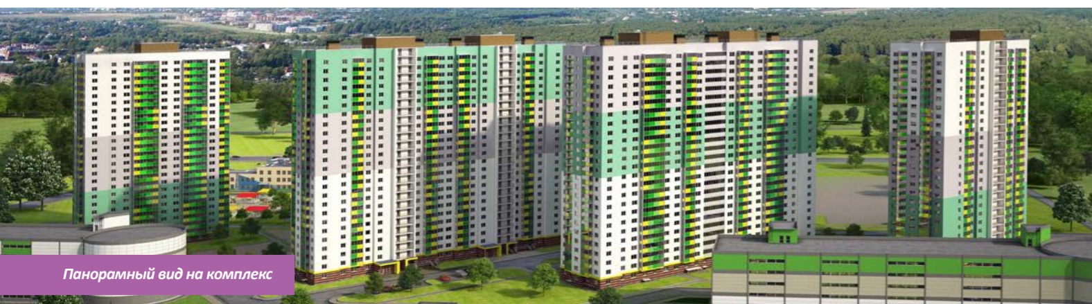
Панорамный вид на комплекс

В рамках благоустройства комплекса предусмотрено озеленение прилегающей территории, оснащение детских и спортивных площадок, организация зон для отдыха и открытых автостоянок. Многоуровневые паркинги рассчитаны на 516 машиномест. Всего в комплексе запланировано 1187 квартир. Первым возводится 4 корпус, включающий 223 одно- и двухкомнатные квартиры с полной чистовой отделкой.