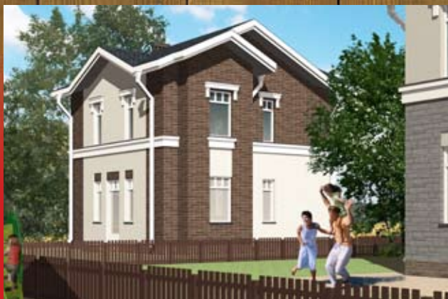
Коттедж — 92 кв. метра