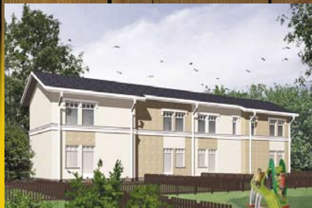
Таунхаус — 66,7 м 2