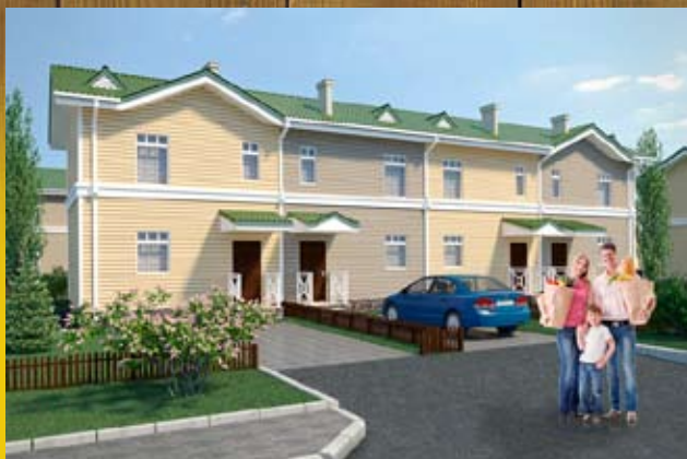
Таунхаус — 56 м 2