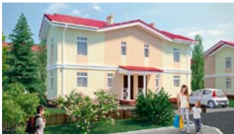
Дуплексы от 3,4 млн руб.