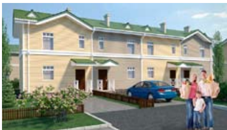
Таунхаусы от 2,9 млн руб.