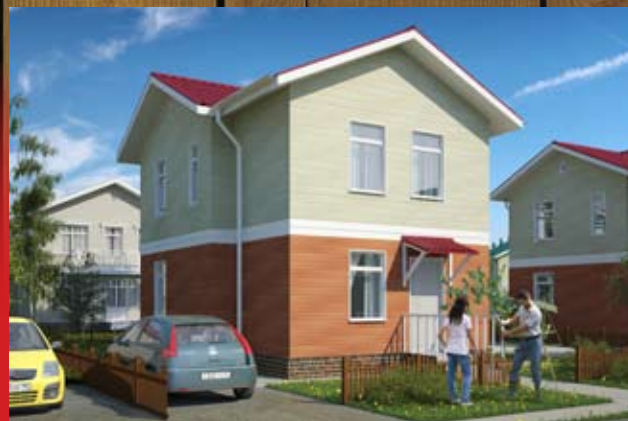
Коттедж — 98 кв. метров