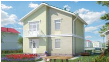
Коттеджи от 4,2 млн руб.