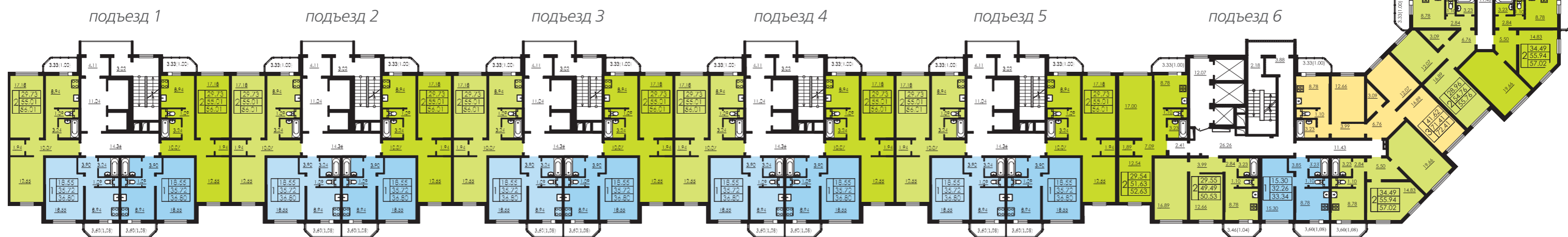
ПЛАН 3-5 этажа