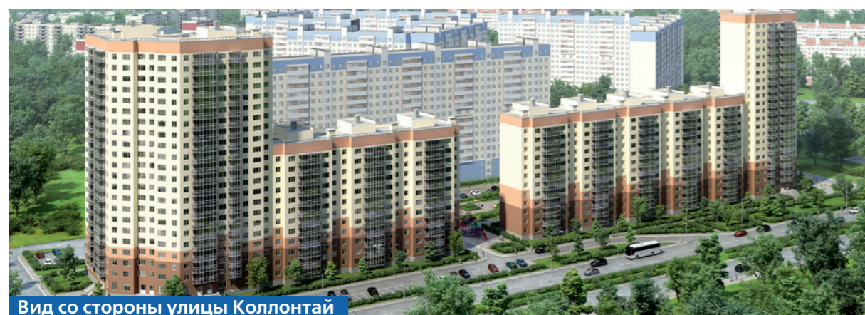
Вид со стороны улицы Коллонтай

Рядом открыт офис продаж: ул. Коллонтай, д. 5, тел. (812) 326-01-01