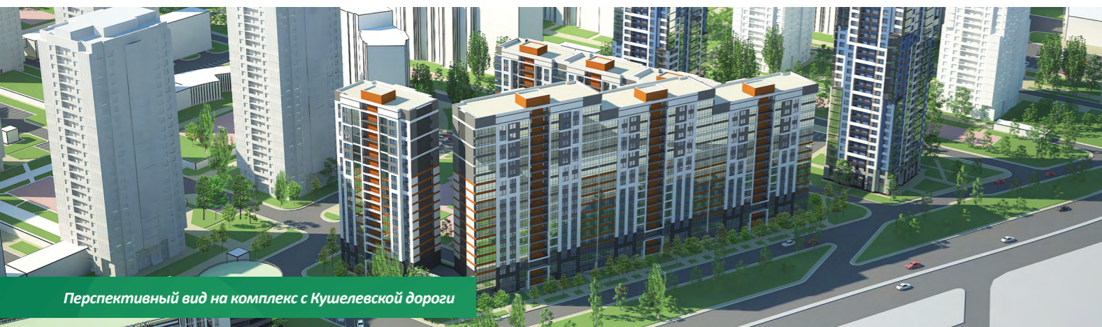
Перспективный вид на комплекс с Кушелевской дороги

ЖК «Калина-парк» расположен в окружении развитой торговой и социальной инфраструктуры. Рядом гипермаркеты Карусель, Максидом и Метрика, мебельные центры Мебель Сити и Аквилон, торгово-развлекательные центры, кинотеатр, боулинг центр. В шаговой доступности несколько школ и детских садов, поликлиники, аптеки, отделения банков.